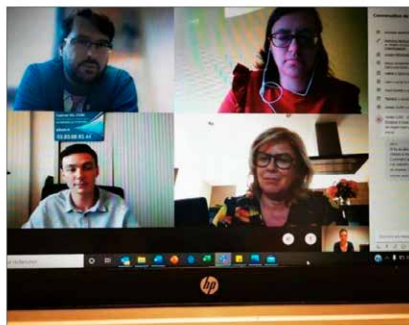
La plateforme dématérialisée, mise en place au mois d'avril, a donné satisfaction. Elle offre de nouvelles possibilités d'échanges, son utilisation se poursuivra.

Les animations collectives se mettent en place à partir de la plateforme. La première s'est déroulée avec les locataires des pépinières, « un