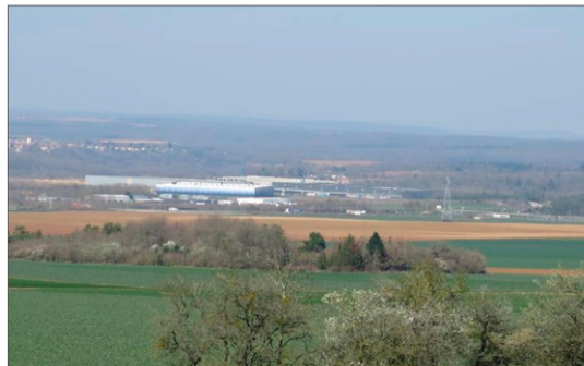
L'agence de développement Terres de Lorraine assure une veille économique pour les entreprises. Elle anticipe aussi des phénomènes comme le manque de saisonniers dans l'agriculture.

Plusieurs points ont été traités : les délais de paiement, les mesures d'aides aux entreprises, la gestion du personnel, le